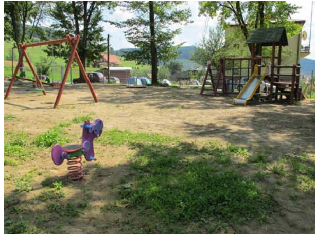
Plac zabaw w Jastrzębiku