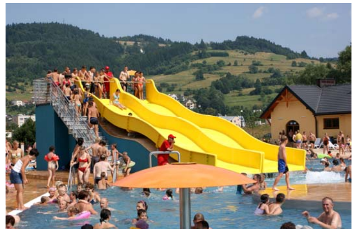
Baseny w Muszynie