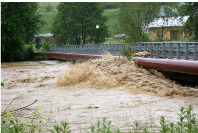
Most na Folwarku