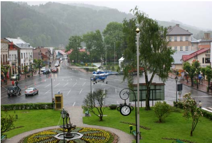
Działania ewakuacyjne z wykorzystaniem śmigłowca

W wyniku czerwcowej powodzi aż 310 rodzin zostało poszkodowanych. Na tę liczbę składają się zarówno rodziny, które poniosły straty w budynku mieszkalnym jak również na posesjach, garażach i budynkach gospodarczych. U wszystkich tych rodzin został spisany protokół szkód.