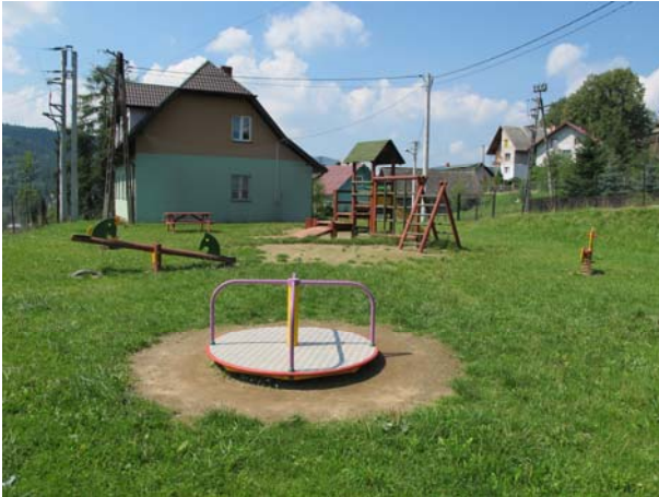
Plac zabaw w Andrzejówce

Młodzież i dzieci w naszej gminie nie mogą narzekać na realizację infrastruktury sportowej i rekreacyjnej. W ostatnim czasie (maj, czerwiec, lipiec) oddano do użytku kilka placów zabaw i obiektów sportowych. Nowy obiekt sportowy z placem zabaw otrzymały: Andrzejówka (obiekt przy szkole), Żegiestów (obiekt przy szkole podstawowej), Jastrzębik (obiekt przy szkole). Na realizację nowych obiektów sportowych i placów zabaw oczekują jeszcze: Powroźnik (boiska przy szkole), Szczawnik, Milik.